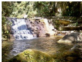
1- Cachoeira Pico da Lagoinha

A Área de Proteção Ambiental Estadual de Maricá é uma área tipicamente de restinga, localizada na costa do município. É formada pela antiga fazenda São Bento da Lagoa, a Ponta do Fundão e a Ilha Cardosa. Abriga a Comunidade Pesqueira tradicional de Zacarias, presente na área desde o século XVIII, sítios arqueológicos e o complexo ecossistema de restinga.