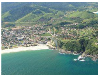
2 – Ponta Negra

Localizada no ponto mais alto do município, no Espraiado, a Cachoeira do Pico da Lagoinha serve de tríplice divisa entre Maricá, Tanguá e Saquarema. É local ideal para excursões.