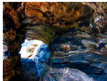
3- Gruta de Ponta Negra

Ponto de referência para os antigos navegadores, o Farol de Ponta Negra está incorporado ao patrimônio turístico e cultural da cidade.