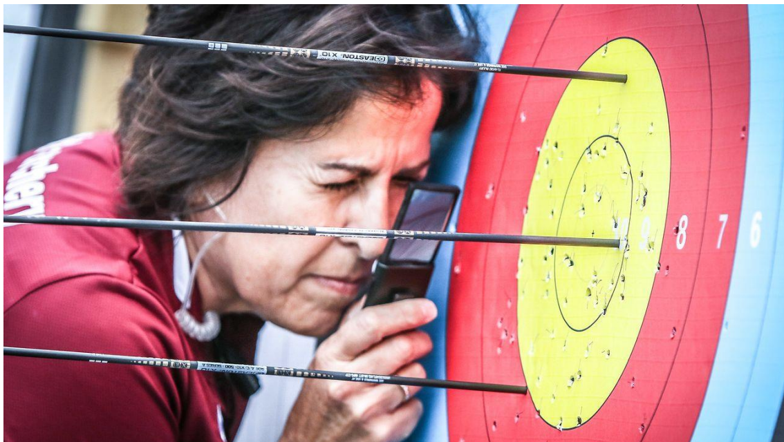
International Judge Celine Gravel (CAN)

(4), Chile (21), Colombia (25), Costa Rica (1), República Dominicana (11), Ecuador (21), El Salvador (3), Guatemala (8), Guyana (10), Honduras (4), Islas Vírgenes Británicas (1), Islas Vírgenes USA (1), México (57), Panamá (4), Perú (9), Puerto Rico (1), Trinidad y Tobago (16), Estados Unidos (1) y San Vicente y las Granadinas (2).